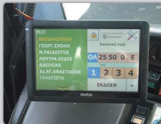
Λογισμικό Έκδοσης Εισιτηρίων από τον οδηγό του οχήματος